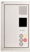
Terminali per celle di detenzione