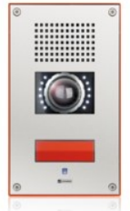
Terminali di chiamata d'emergenza