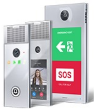
Terminali con touchscreen Serie CONCERTO