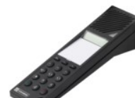
Interfoni da sportello