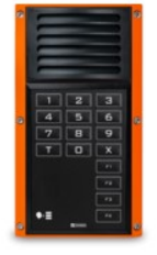
Terminali industriali Serie EE 7000