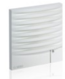
Terminali modulari per ingressi