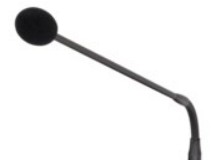
Microfoni e cuffie