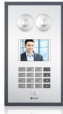
Terminali con lamina di protezione