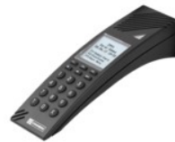
Terminali da tavolo