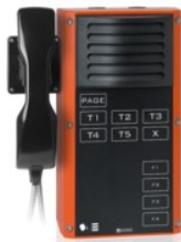
Terminali antideflagranti per zone Ex Serie EX 7000